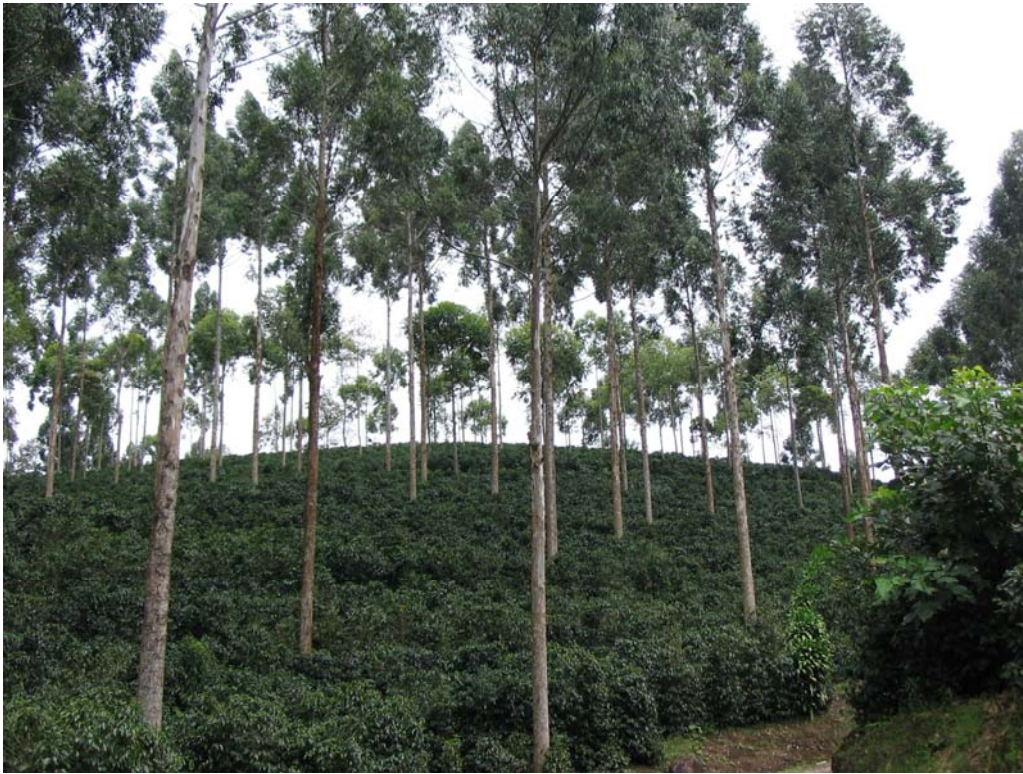
Figura 2. Café con Eucalyptus sp , Cervantes.