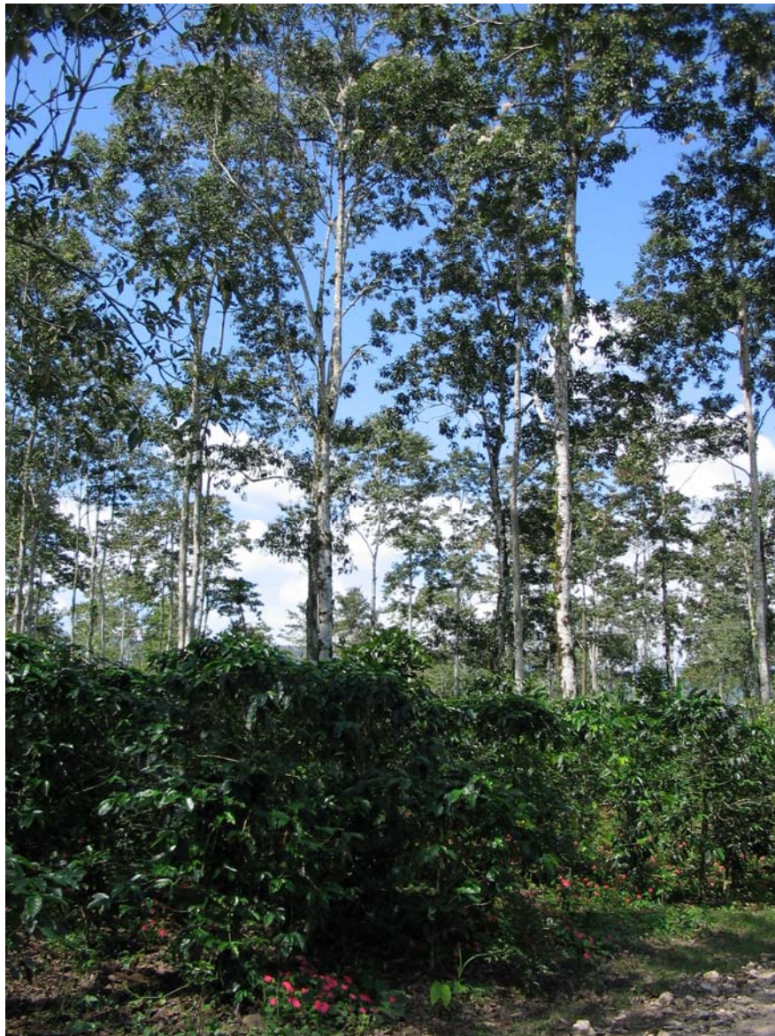
Figura 1. Café con Cordia alliodora , Turrialba.

racional de los recursos y al incremento del bienestar de la población local. Esta metodología integra evaluación y planificación estratégica del manejo agroforestal relativo a la conservación de la biodiversidad en áreas protegidas y sus zonas de amortiguamiento.